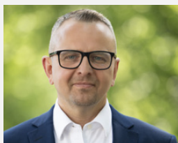
PROREKTOR DS. ORGANIZACJI I INFRASTRUKTURY