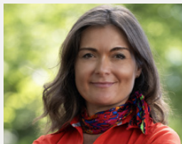
PROREKTOR DS. WSPÓŁPRACY Z OTOCZENIEM