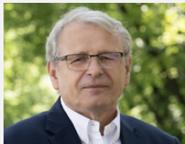
PROREKTOR DS. BADAŃ I INNOWACJI