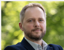
PROREKTOR DS. KSZTAŁCENIA