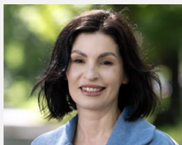
PROREKTORKA DS. ROZWOJU I INTEGRACJI WSPÓLNOTY