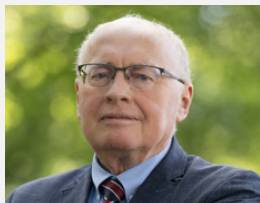
PROREKTOR DS. INFORMATYZACJI